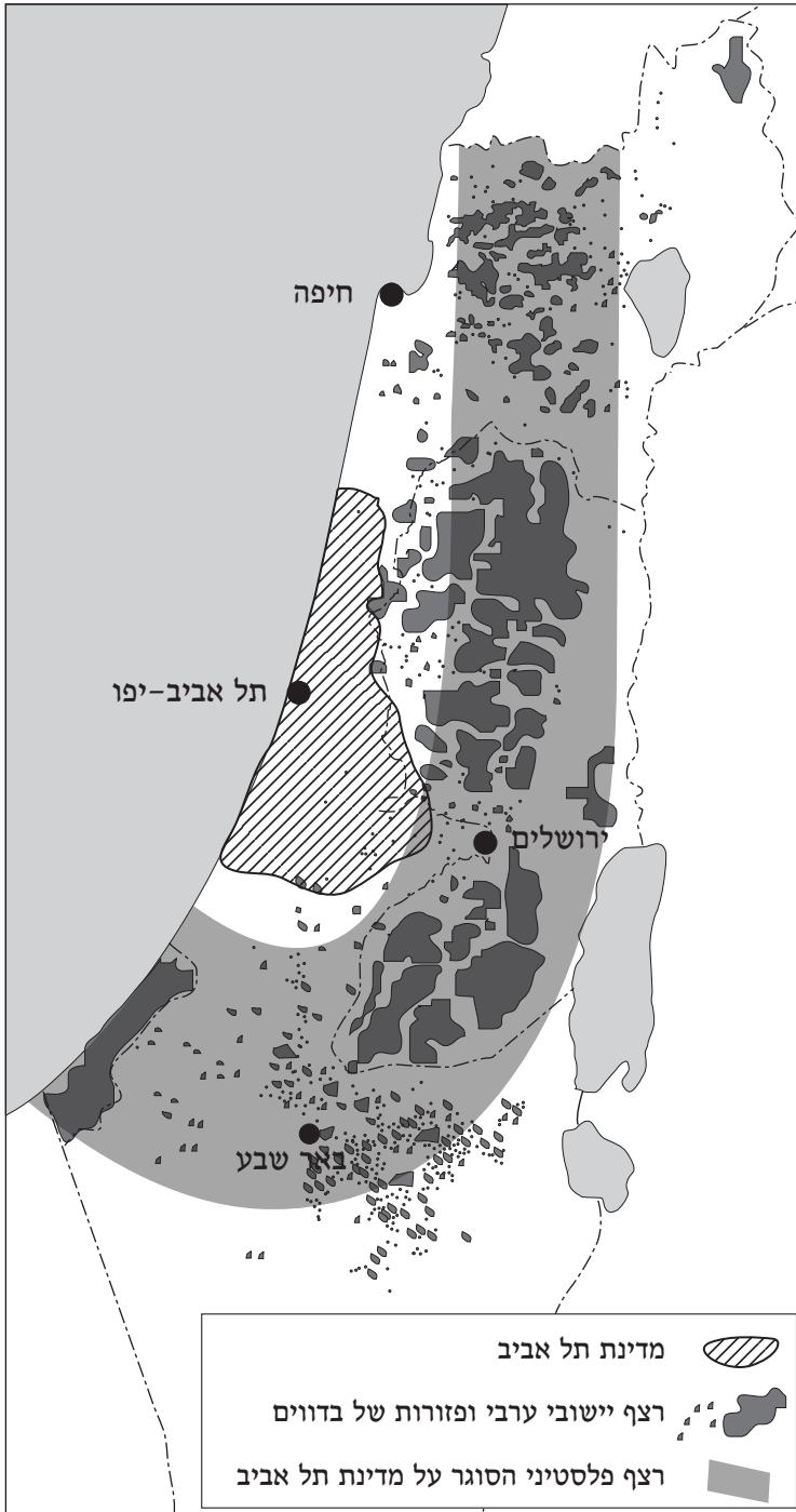
מפה 4: העם הפלסטיני סוגר על מדינת תל אביב