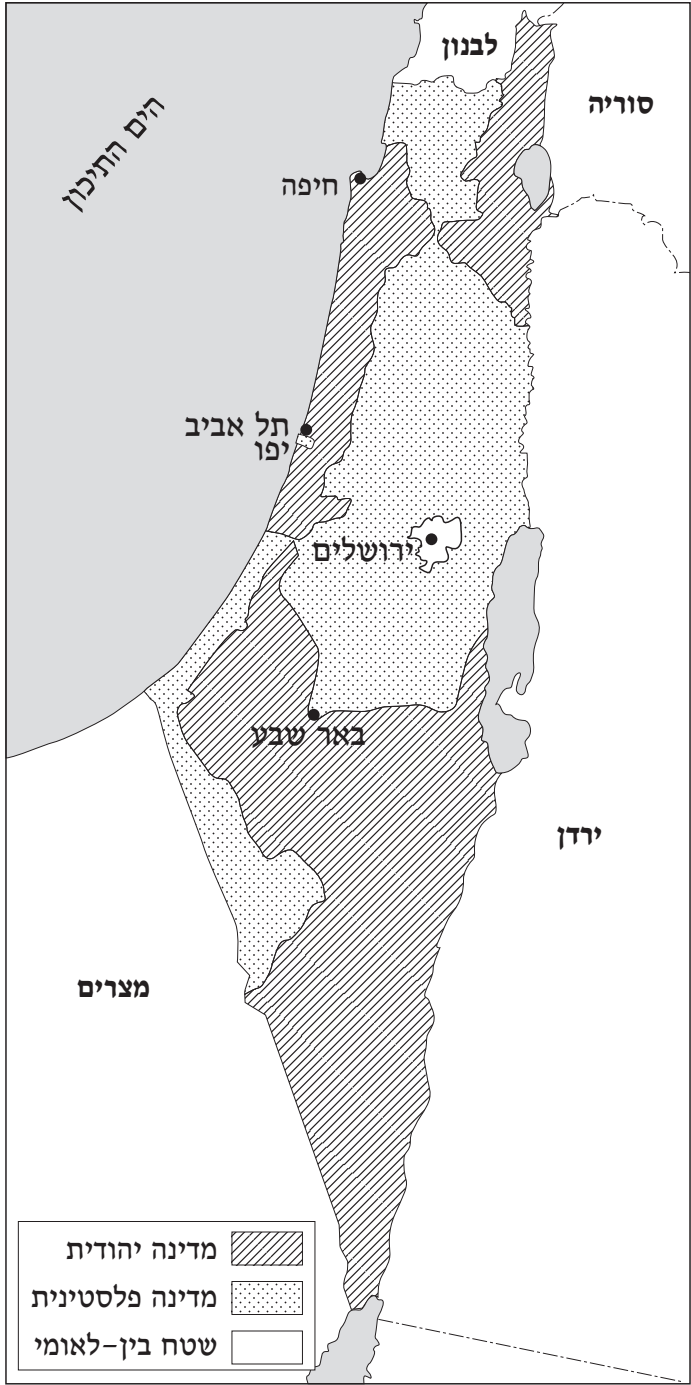
מפה 1: תוכנית החלוקה של 1947